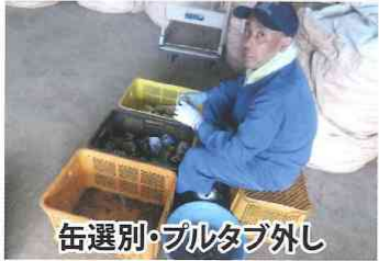
缶選別・プルタブ外し