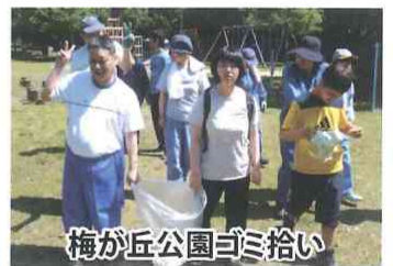
梅が丘公園ゴミ拾い