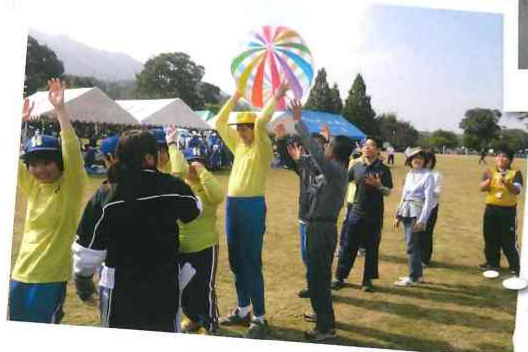
各種障害者 スポーツ大会