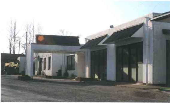
▲昭和60年4月、開所当初の「ひまわりの家」

グループはじまりの施設でしたが、平成23年10月に取り壊し、平成24年4月に新しく生まれ変わりました。