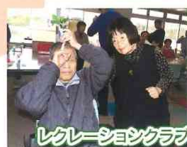
レクリエーションクラブ