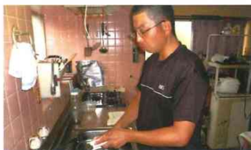
食器洗いもしっかりします