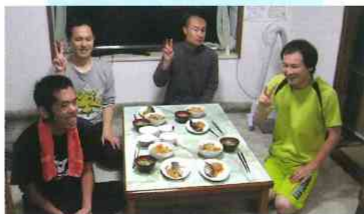
戸建のGHの食事風景