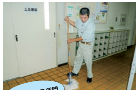
メンテナンス部門