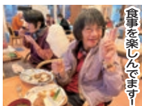
食事を楽しんでいます！

新友会ではグループホーム事業の定員82名の大所帯の事業所となり、今後の制度の変遷やご利用者支援の趣旨を考慮して、「グループホームひまわり辻」をご利用者への支援の目的別に「生活支援」と「自立支援」の大きく2つに事業を分けることになりました。「生活支援」を重きに置いた新設の「第2ひまわり園」と、「自立支援」を重きに置いた「グループホームひまわり辻」になります。今後も新友会ではグループホーム事業の機能をより充実させ、法人のスローガンでもある「親亡き後」の実現に向けて着実に事業展開して行くために今回の事業所編成の変更に至った次第です。「第2ひまわり園」では、朝夕の人員配置を増やし、夜間帯も夜勤職員を常駐させ支援の充実を図ることで、よりきめ細やかな支援を行います。また、医療との連携を密に図れるよう常勤の看護職員の配置を行っています。更には、隣接する入所施設の「ひまわり園」と一体的に事業展開を行うことで、入所施設に近い質の高いサービスの提供を行います。