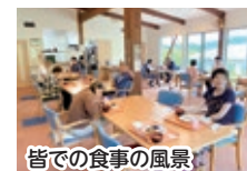
皆での食事の風景