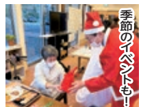
季節のイベントも！