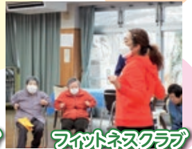
フィットネスクラブ